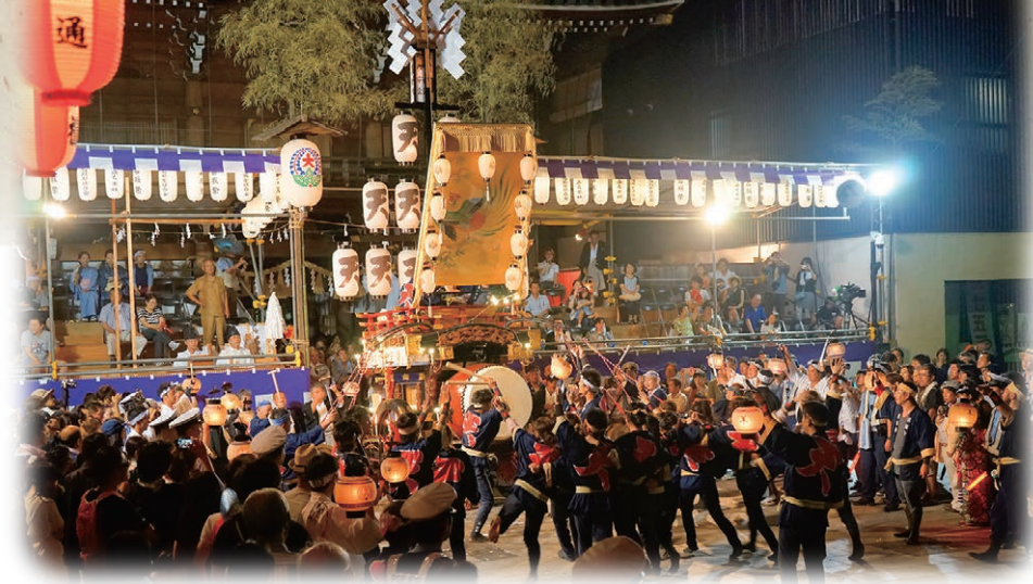
入選 / 最高潮