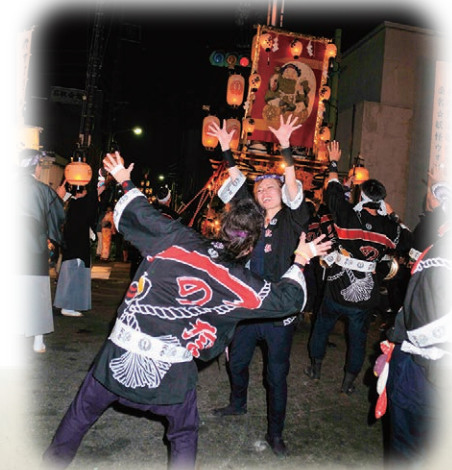
入選 / 祭り最高

石取祭見学の注意とお願い ●祭車には触れないようにお願いします。 ●引き綱をまたぐことはひかえてください。 ●祭車天幕の下には入らないでください。 各自ゴミは必ず持ち帰りましょう。路上駐車は祭車運行の妨げにもなりますので駐車場に入れましょう。安全で楽しい石取祭となるようにご協力ください。