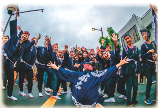
金賞 / 思い切り楽しむ

石取祭見学の注意とお願い ●祭車には触れないようにお願いします。 ●引き綱をまたぐことはひかえてください。 ●祭車天幕の下には入らないでください。 各自ゴミは必ず持ち帰りましょう。路上駐車は祭車運 行の妨げにもなりますので駐車場に入れましょう。 安全で楽しい石取祭となるようにご協力ください。