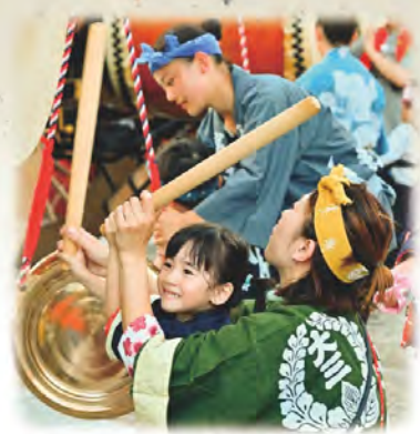
入選 / 母から子へ

南市場整列のため 益生駅下車徒歩5分 ほどで祭車の末番 よりご覧になれます。 午後3時～午後4時30分