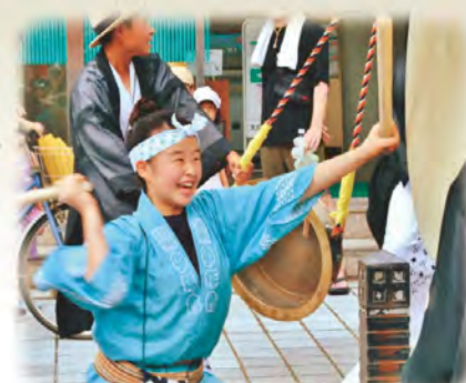
入選／うれしさ爆発